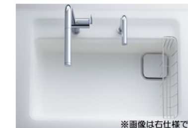
※画像は右仕様です スクエアすべり台シンク(クリスタル)/クリスタルスノー