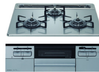
ガラストップ 両面焼きコンロH:シルバー