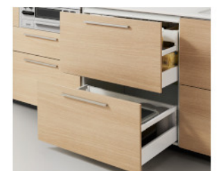
2段引き出し(上段スライドトレイ付き):ステンレス底板