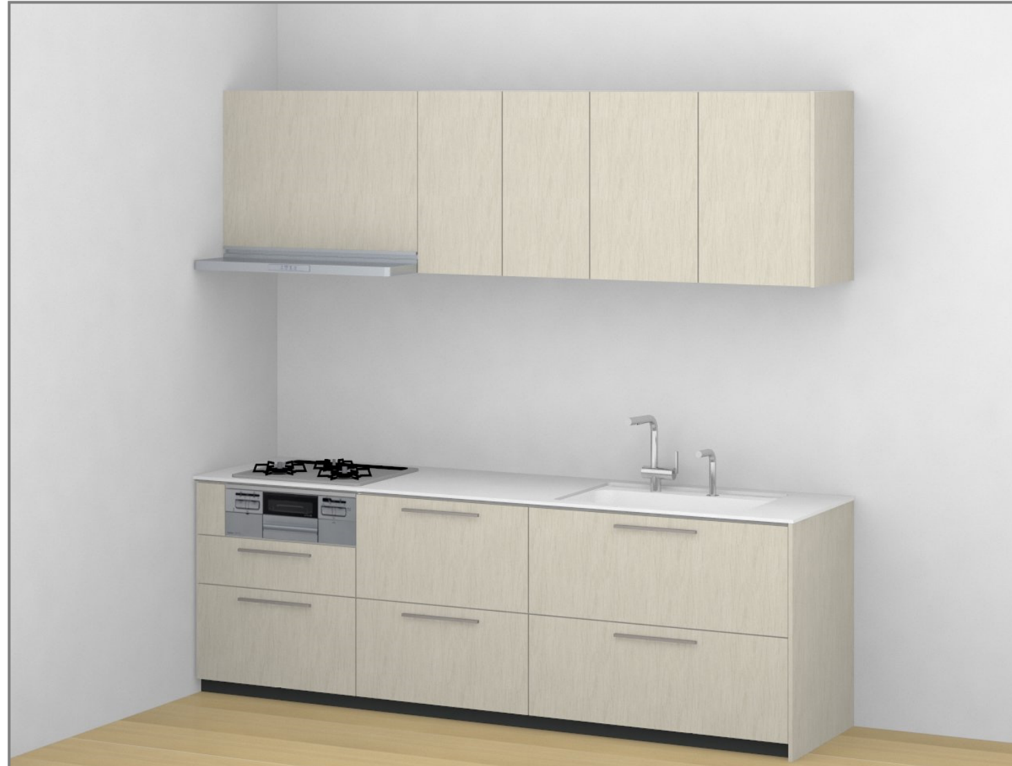
画像はイメージです。商品に床などの写り込みがあります。