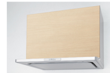
ゼロフィルターフードeco(扉材前幕板):シルバー