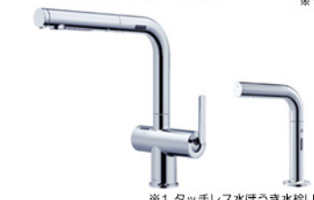
※1 タッチレス水ほうき水栓LFが対象 タッチレス水ほうき(浄水)+タッチレス「きれい除菌水」