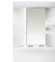
スタンダードLED1面鏡(くもりシャット付き)