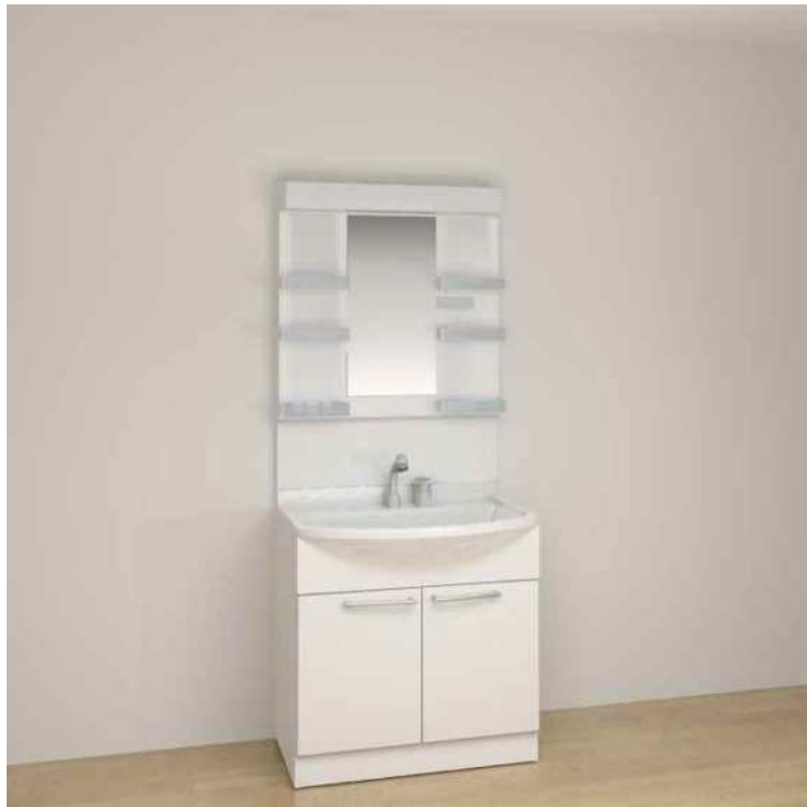
※画像はイメージです。組合せなどはお見積書をご確認ください。