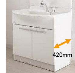
本体キャビネットは奥行き420mmのコンパクト設計です。