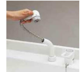
コンパクトで水はねしにくいシングルレバーシャワー。洗髪時はリフトアップでき、両手が使えます。