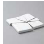
※弊社基準に基づき行った実験結果であり、製品の耐久性を保证するものではありません。