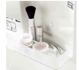
使いやすさにこだわったシンプルなデザイン。化粧小物などが置けるスタイリッシュなトレイです。