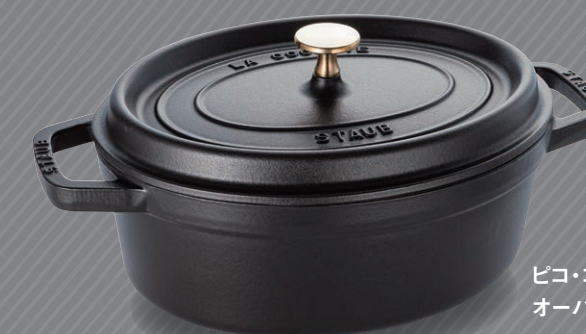
ピコ・ココット (27cm) オーバル、ブラック