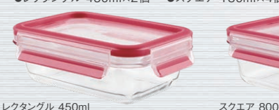
レクタングル 450ml スクエア 800ml

マスターシール グラスセット (耐熱ガラスの保存容器) ●レクタングル 1.3L×1個 ●スクエア 800ml×2個 ●レクタングル 450ml×2個 ●スクエア 180ml×4個